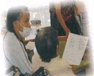
皆で歌詞カードを見て歌いました。

ボランティアの皆さんが来て下さり、歌とハンドベルを披露していただきました！ 日々の療養の中でなかなか季節感を味わっていただく事が少ない入院生活ですが、少しでもイベント気分を楽しんでいただけたら嬉しく思います。