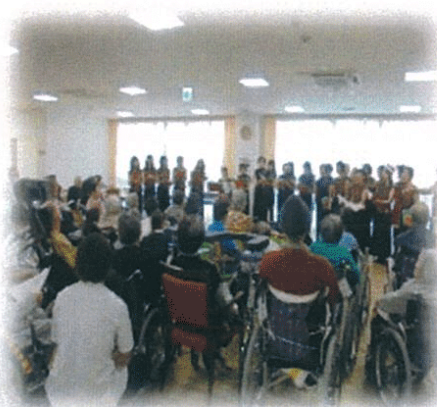
総勢25名の歌声は迫力がありました！