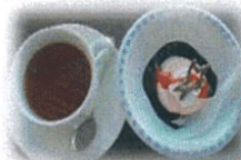
お茶菓子はババロアでした。