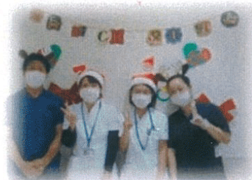
スタッフも一緒に楽しみました★