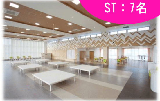
とにかく明るい訓練室